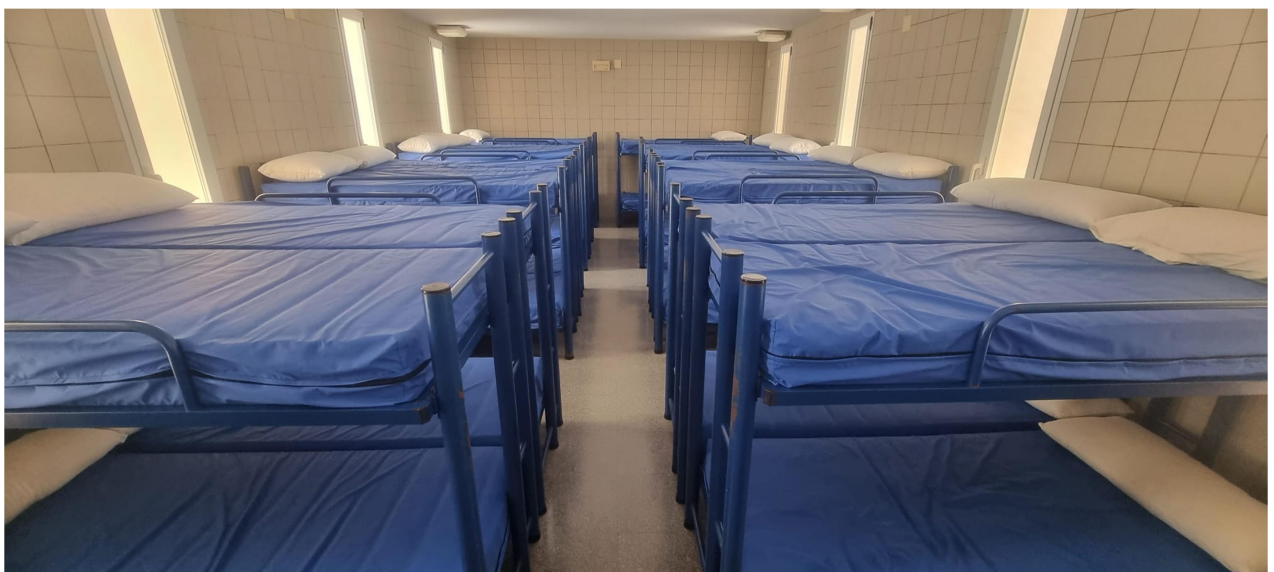
Sala dormitorio con 30 literas.