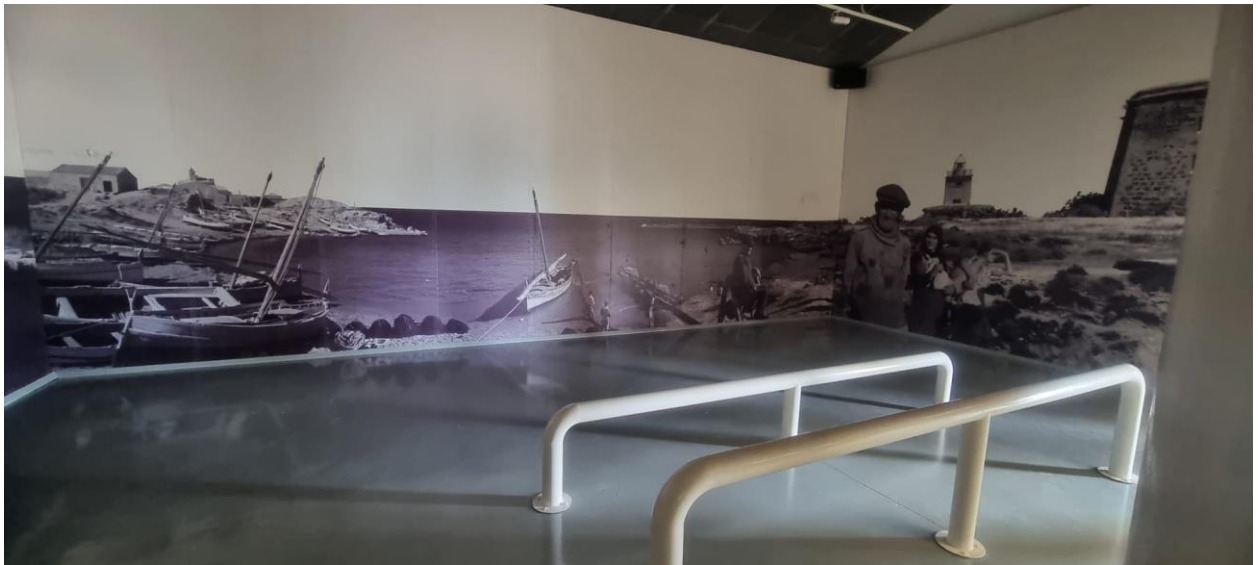
Imagen zona realización evento yoga: