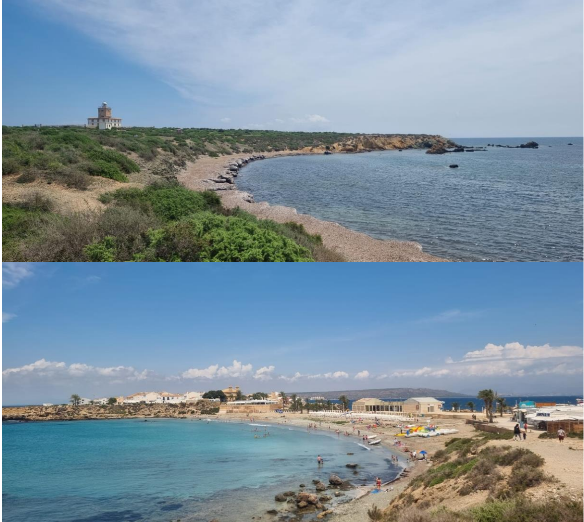
Imágenes Museo de Tabarca: