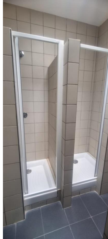
Aseos y duchas (4 unidades).